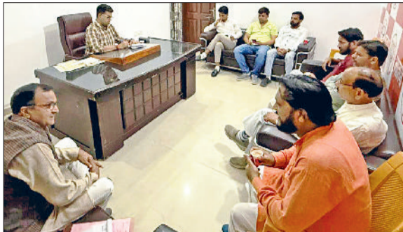
नारनौल। बैठक करते भागपा कार्यकर्ता।