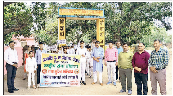
नारनौल। तंबाकू नशा मुक्ति रैली निकालते विद्यार्थी व स्टाफ सदस्य।

सरकारी अस्पतालों में आरक्षित कर दिया। जिसके कारण गरीब व्यक्ति जो आयुष्मान व चिरायु योजना के तहत गंभीर बीमारियों का इलाज निजी इमैलन अस्पतालों से करवाते थे, अब निजी अस्पतालों से नहीं करवा सकेंगे। उन्हें सरकारी अस्पतालों के चक्कर काटने पड़ेंगे। जहां इन बीमारियों के इलाज की सुविधा तथा व्यवस्था नहीं है। किसान, मजदूर, अनुसूचित तथा गरीब लोग इन सरकारी अस्पतालों में बिना संसाधन, बिना मशीन, बिना विशेषज्ञ व बिना सुविधाओं के गंभीर बीमारियों का इलाज कैसे करा पाएंगे। उन्होंने कहा कि सरकार के इस निर्णय से अब गरीब लोग प्राइवेट अस्पतालों में कूल्हा बदलना, घुटना बदलना, हर्निया, कान के पर्दे की समस्या, अपेंडिक्स, टॉसिल, गले, बवासीर, यूरिनल, उदर हिस्टेरेक्टॉमी, सीओपीडी आदि गंभीर बीमारियों का इलाज नहीं करवा पाएंगे। उन्होंने कहा कि सरकार ने केवल अपना बजट देखा है, जबकि गरीब लोगों की स्थिति नहीं देखी।