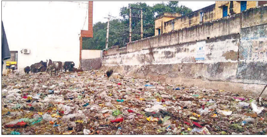
महेंद्रगढ़। मंडी में लगे कूड़े का ढेर।

है। तेज हवा चलने पर कूड़ा दुकानों में घुस जाता है। जिसके कारण परेशानियों का सामना करन पड़ रहा है।