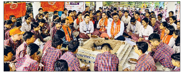
नारनौल। हवन करते विद्यार्थी व स्कूल स्टाफ।