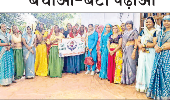
महेंद्रगढ़। कार्यक्रम में उपस्थित महिलाएं।