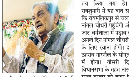
नारनौल। बैठक को संबोधित करते चौधरी बीरेंद्र सिंह।