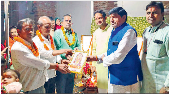
नारनौल। यजमान को स्मृति चिह्न भेंट करते हुए।