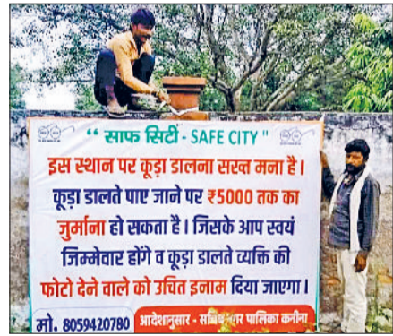
कनीना। नपा द्वारा चिह्नित प्लांट पर लगाए गए बोर्ड।