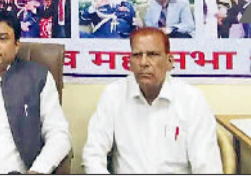
महेंद्रगढ़। पैसेल में पत्रकार वार्ता करते हुए।

कार्यक्रम के उपरान्त एक विशाल कलश यात्रा जुलूस अमर शहीद राव तुलाराम को नमन कर वहां से शुरू किया जाएगा और वह बालाजी चौक, सब्जी मंडी, परशुराम चौक, मसानो चौक, गौशाला रोड होते हुए माजरा चुंगी पर तक जाएगा। शहर में विभिन्न समाज एवं सामाजिक संगठन कलश यात्रा का स्वागत एवं नमन करेंगे। वहां से यात्रा मालडा गांव जाएगी, वहां शहीद नमन सभा के उपरान्त गांव झुंझ के रेजांगला के शहीदों को नमन करते हुए यात्रा का समापन होगा। तीन नवंबर को नारनौल में नसीबपुर के 1857 शहीद स्मारक से कलश यात्रा शुरू होगी और जिला न्यायालय, महावीर चौक, रेजांगला चौक हरी होंडा चौक होते हुए गांव मांढी में एक विशाल शहीद नमन सभा के साथ समापन होगा।