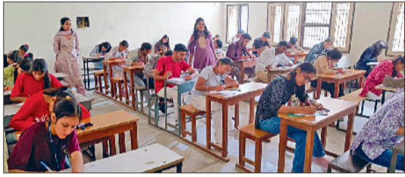
नारनौल। निबंध प्रतियोगिता में भाग लेते विद्यार्थी।