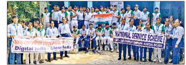
महेंद्रगढ़। कार्यक्रम में उपस्थित विद्यार्थी।