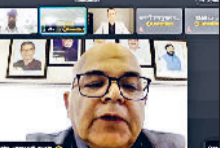
महेंद्रगढ़। विशेषज्ञ व्याख्यान में प्रतिभागियों को संबोधित करते कुलपति।